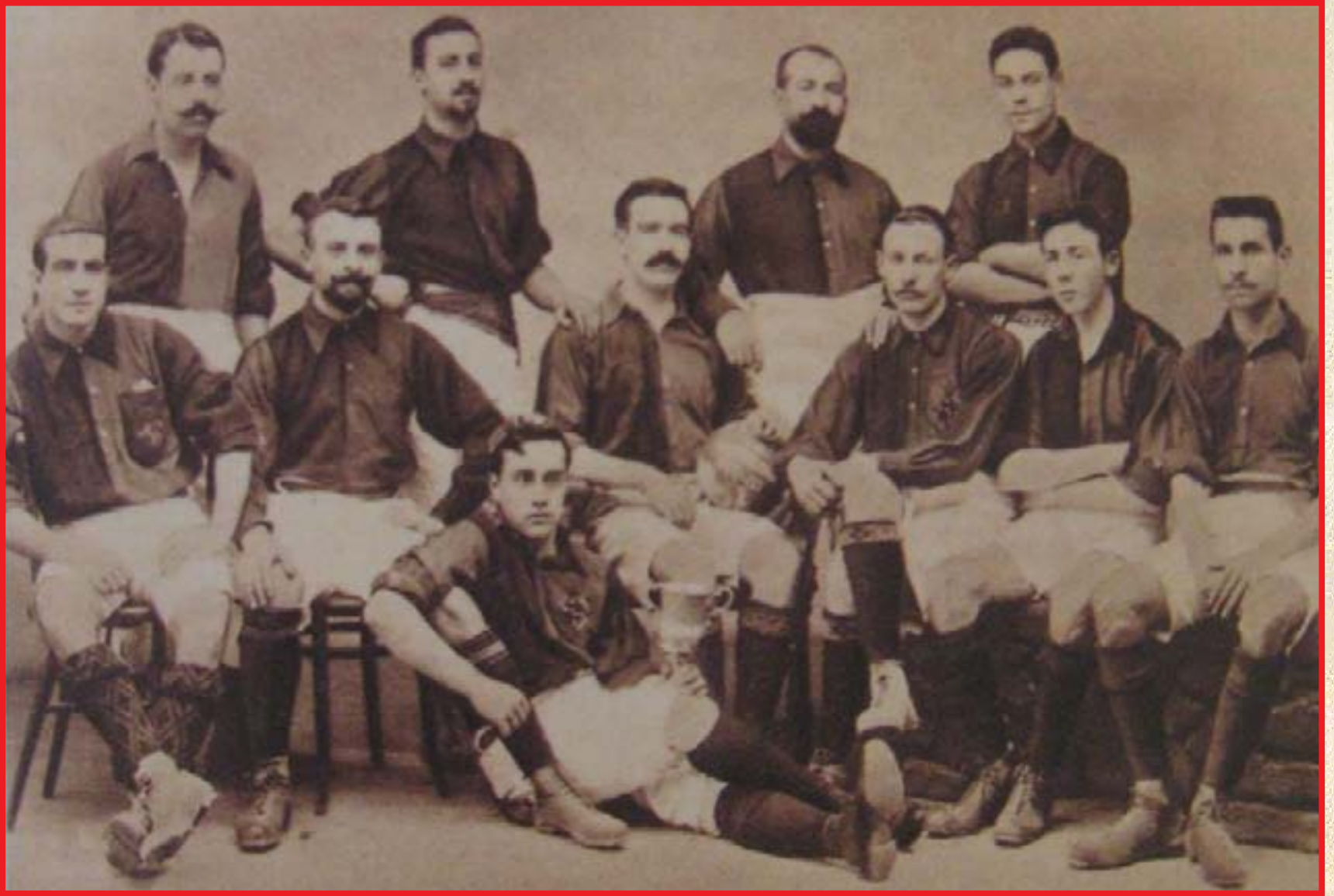
لاعبو فريق برشلونة الاسباني لكرة القدم عام ١٩٠٣