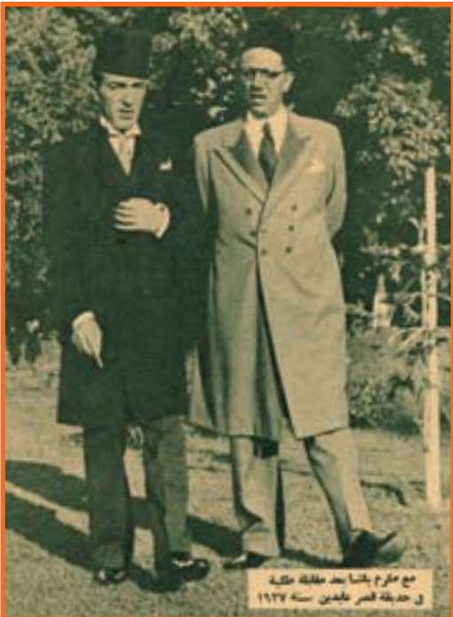
مع مكرم باشا بعد حفلة عذبة في حديقة قصر سليمان سنة ١٩٢٧

وفي سنة ١٩٢٧ كان التابعى هو الوسيط بين القصر والوزارة النحاسية وقد سافر مع جلالة الملك الى سويسرا وفرنسا وانجلترا. وكانت صلته بالوفد طيبة، فاستطاع ان يتوسط في الخلاف القائم، ولكن كان التيار أقوى من وساطته.. واضطر الى ان يعود الى اوروبا يائساً.. وبعد بضعة اسابيع من سفره اقبلت وزارة النحاس باشا الثالث. وكتب التابعى سلسلة مقالات كشف فيها الستار عن اسباب الخلاف. وغضب الوفد على التابعى.. وهدد بان يعلن ان مجلة آخر ساعة لا تعبر عن رأي الوفد.. فما كان من التابعى إلا ان أعلن هو في الصحف انه لا صلة لآخر ساعة بحزب الوفد.. وكانت هذه اول مرة تنسب فيها جريدة في مصر من الوفد، وكذلك أول مرة تخرج فيها جريدة على الوفد وتبقى أقوى مما كانت وهي وفدية!