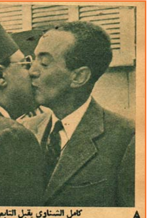
كامل الشناوى يقبل التابعى مودعا

وفي سنة ١٩٢٦ أصدر التابعى جريدة المصري مع الأستاذ محمود ابو الفتاح وكريم ثابت بك فنجحت المصري نجاحاً كبيراً.. وكان التابعى معروفاً بالوفدية وكان ابو الفتاح من خصوم الوفد ورأى التابعى ان يبيع حصته في الجريدة، وباعها للنحاس باشا بثلاث الاف جنيه - وانفق المبلغ في شهرين في سان مورينتز! وتقدر قيمة حصه التابعى الآن باكثر من مائة الف جنيه! ولكن التابعى كان قد اعطى كلمة ان لا يبقى في المصري اذا اختلف النحاس مع الملك واحترم كلمته.. وخسر المائة ألف جنيه! وقد ينشر التابعى مذكراته في هذا الموضوع في يوم ما. ولقد كسب التابعى من الصحافة اكثر مما كسب صحفى آخر في