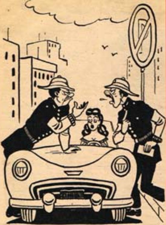
عسكري المرور زميله! بالقول لك انك انتكها والفة هنا قبلك ! انا التي احذر لها المخالفة !