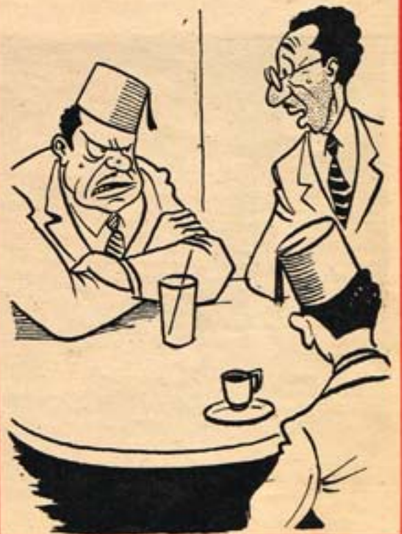
- انت التجوزت والا لسه بترفع شرايتك وتطيخ لنفسك ؟ - التجوزت ولسه بارفع شرايتي واطبخ لنفسى ٠٠٠ ولغيري !