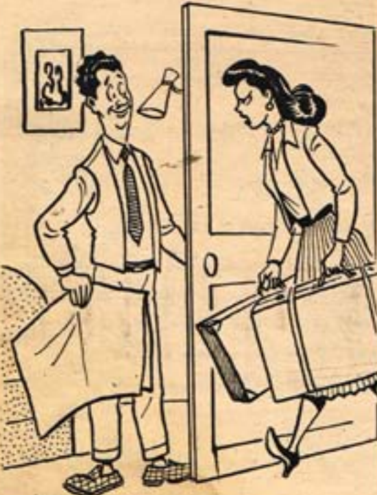
هي - انا اتخلفت مع جوزي ... ماما مين ! زوج الام - اتخلفت معابا .. وراحت عند امها !