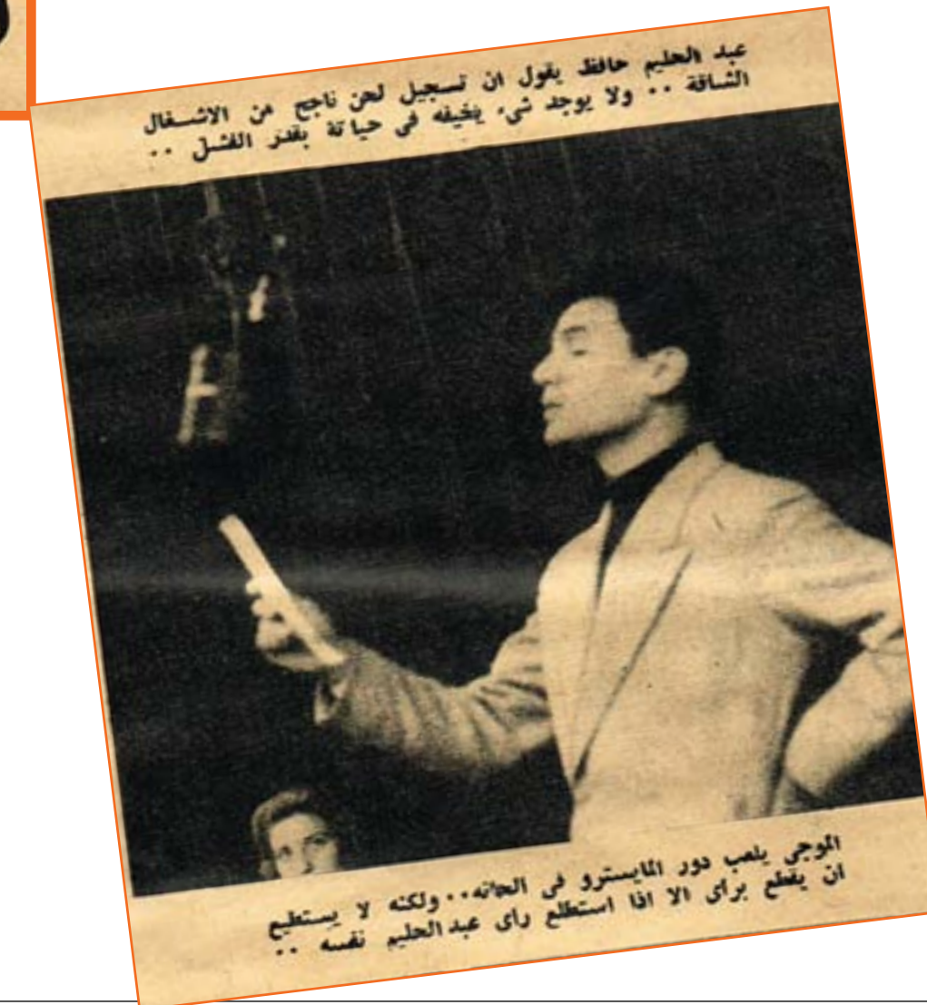
عبد الحليم حافظ يقول ان تسجيل لحن ناجح من الانشغال الشاقه .. ولا يوجد شيء يخيفه في حياة بقدر الفشل ..