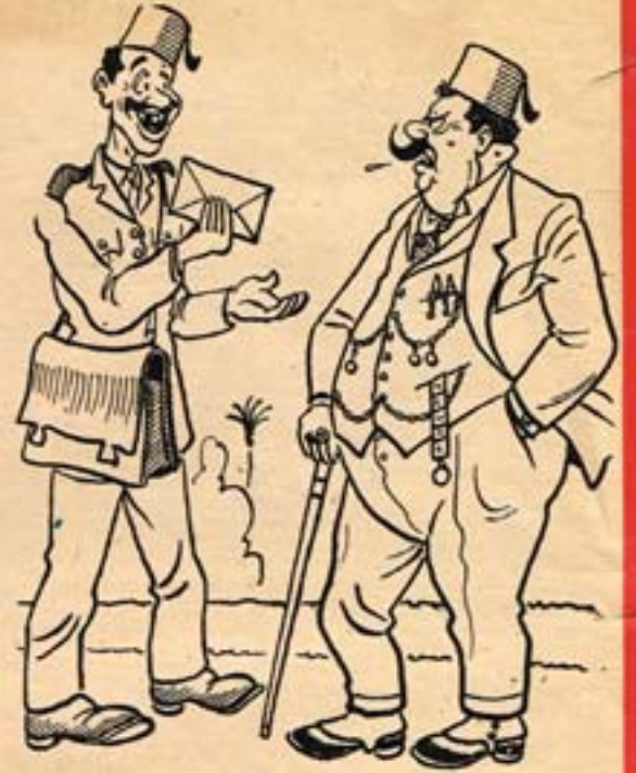
الساني - الجواب ده لسيلتك بالطيارة لني الحرب - كلام فارغ انا شفتك وانت جاي ماني على رجلينكعلاية هنا !